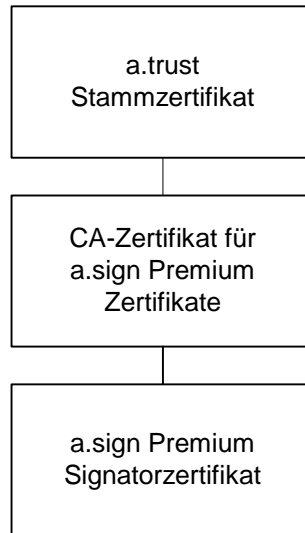
Abbildung 1 Zertifizierungshierarchie